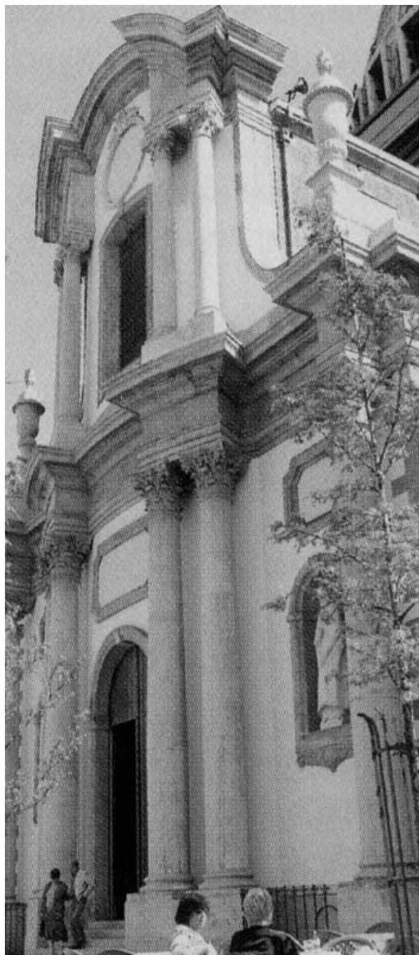
L'église Saint-Christophe (Charleroi - Belgio)