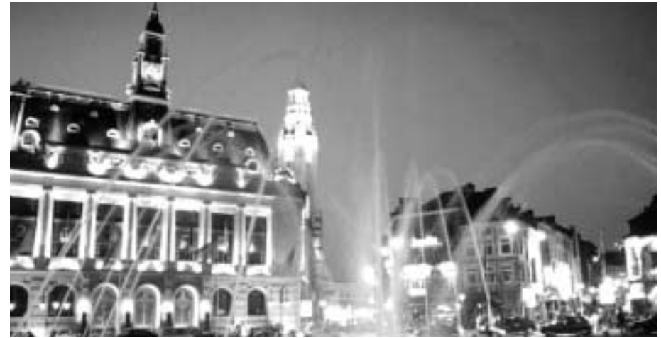
Charleroi, place Charles II (Belgio)

Il gruppo concorda sulla particolarità dell'esperienza italiana che continua a collocarsi come un modello che può ulteriormente evolversi, ma nello