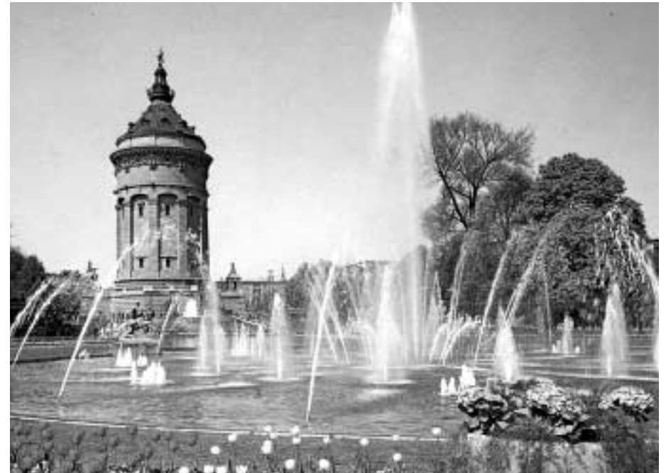
Fontana e torre di Mannheim (Germania)

Le singole realtà locali e nazionali hanno evidenziato un grado di diffusione di iniziative avente il carattere di social firm assai disomogeneo. Vi sono realtà in cui vi è una tradizione ormai consolidata nel campo delle social firms e dove il numero delle iniziative comincia ad acquistare una dimensione significativa anche in rapporto all'ordinario ambito del mercato del lavoro. In altre aree le esperienze di social firm hanno invece ancora un carattere sostanzialmente sperimentale ed il loro numero è assai contenuto; si tratta perlopiù di iniziative con un connotazione intermedia fra il laboratorio protetto (o altra struttura a carattere riabilitativo/formativo) e la social firm e che sono frutto di un processo di graduale avvicinamento all'implementazione effettiva di esperienze di quest'ultimo tipo.